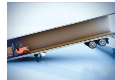
Trailer opwaarts gaat.

Het introduceren van een zware taak trailer steun die een veilige ondersteuning biest wanneer het wordt geplaatst onder een gesignaleerde semi-trailer op het laadperron. Rite-Hite's TS-2000 Trailersteun is een robuuste trailer ondersteuning dat help het laadperron veiliger te maken.