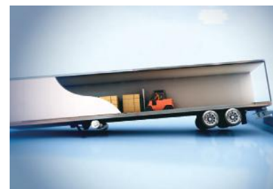
Vorkomt dat landingsgestellen ineenstorten.