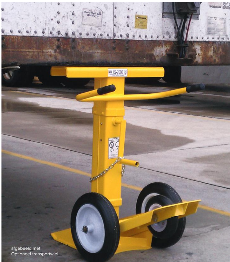
afgebeeld met Optioneel transportwiel

Minimaliseren laadperron ongevallen bij het laden en lossen van gesignaleerde trailers.