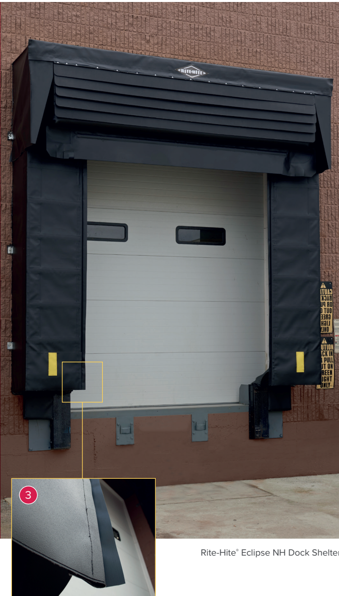
Rite-Hite ® Eclipse NH Dock Shelter.