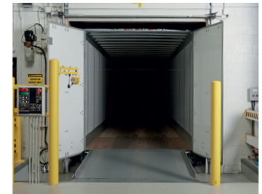
Eclipse NH in een drive-thru toepassing.

Of bezoek onze website voor meer informatie over de volledige assortiment of aanvullende Rite-Hite oplossingen.