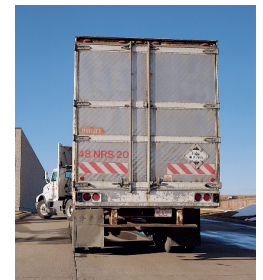
De Eclipse NH dockshelters dichten zowel trailers met laadklep, als standaard trailers met deuren af.