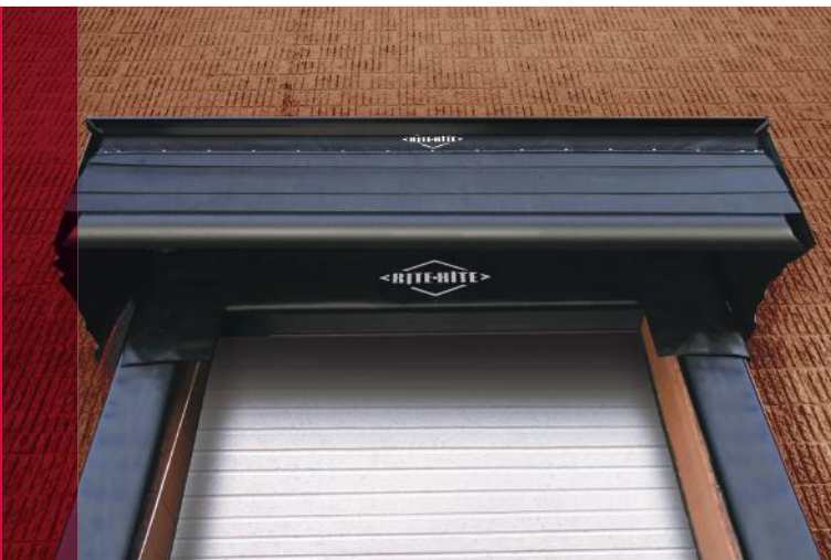
RainGuard è indicata per quasi tutte le guarnizioni o i portali di baie di carico.