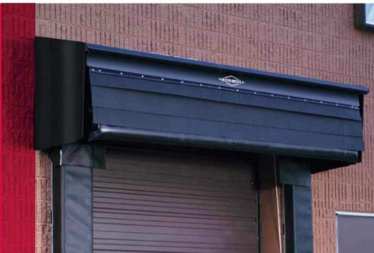
La guarnizione di testata RainGuard di Rite-Hite®.

La guarnizione RainGuard per i tetti dei rimorchi è dotata di un cuscino sigillante pesante e cilindrico in schiuma, che fornisce una pressione costante di 45 kg restando sempre a contatto con il rimorchio mentre si alza e si abbassa durante le operazioni di carico e scarico. Si viene a creare uno sbarramento che impedisce all'acqua di raggiungere la baia di carico, formando una barriera contro luce, polvere, insetti e vento.